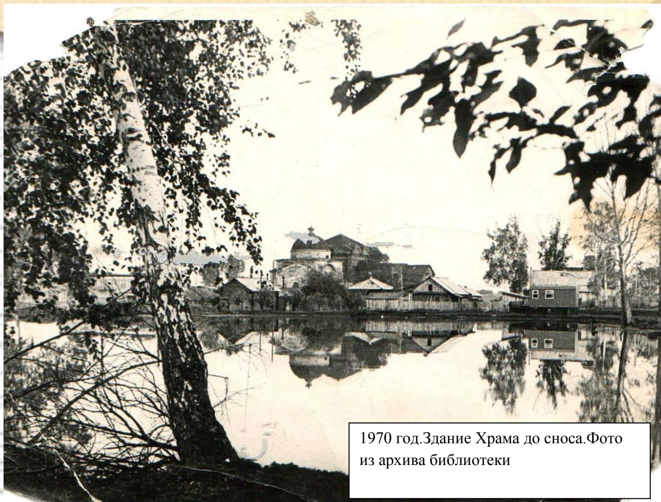
1970 год. Здание Храма до сноса.

Этот снимок поистине уникален. На нём видна часть здания Храма до сноса. В 70-е годы был разрушен придел святого великомученика Георгия Победоносца, небольшой белокаменный Храм, стоявший рядом с Храмом Рождества Иоанна Предтечи.