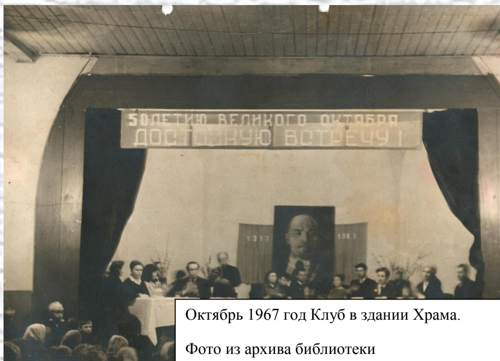
Октябрь 1967 год Клуб в здании Храма.