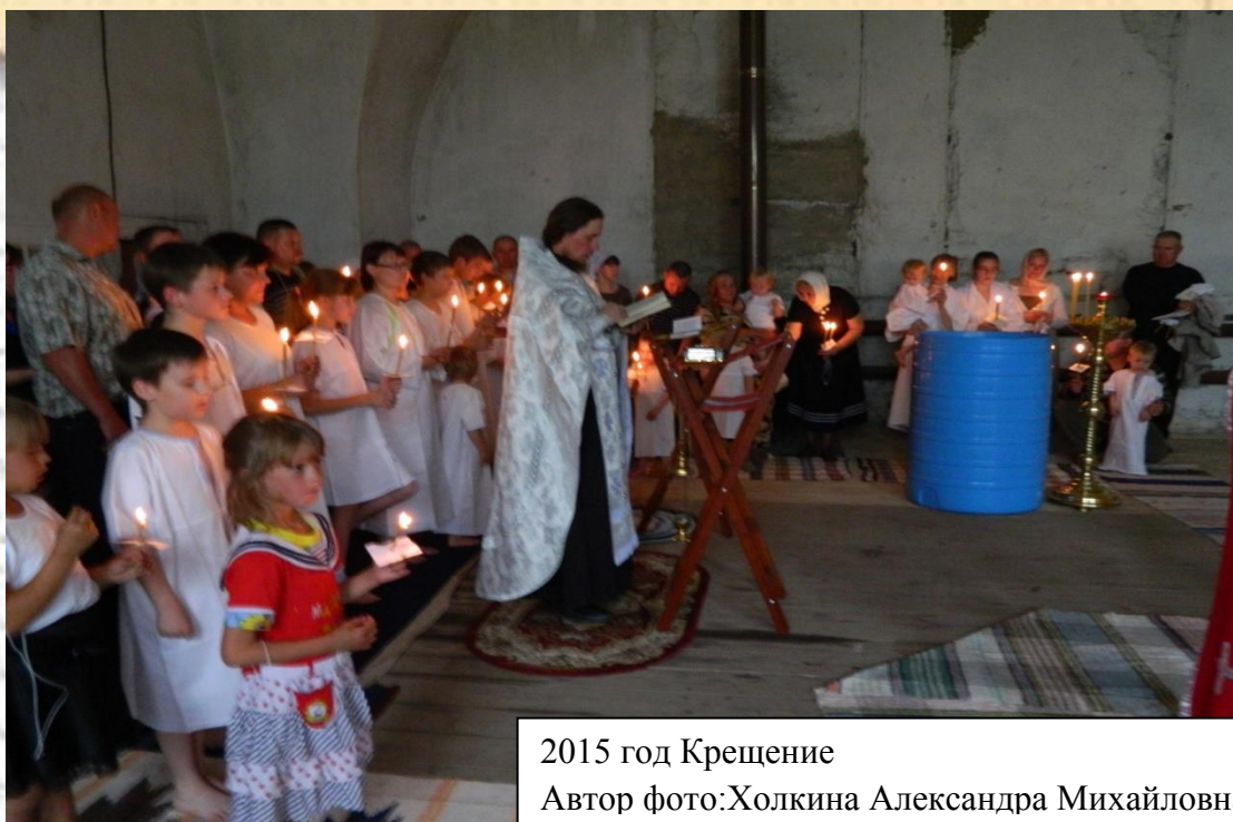
2015 год Крещение

И взрослые и дети рады, что можно быть всем вместе молитвенно в своем родном храме. Церковь в селе Гарашкинское – это настоящая жемчужина, с далёким историческим прошлым, сохранившаяся до наших дней.