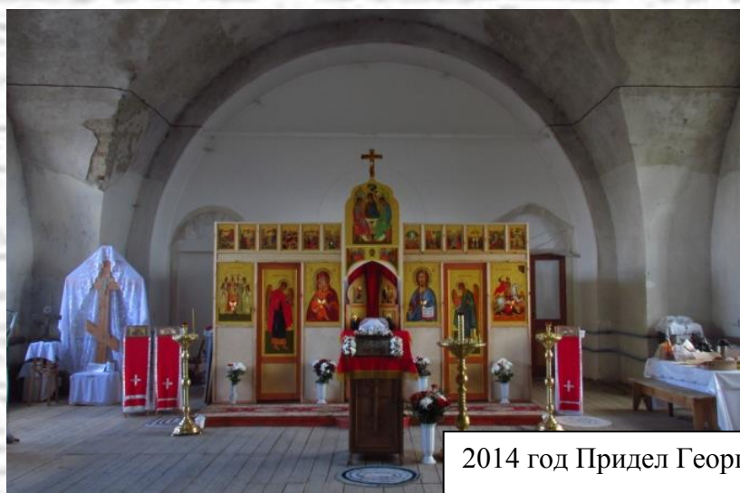
2014 год Придел Георгия Победоносца